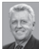
Ernst Pfister MdL Wirtschaftsminister des Landes Baden-Württemberg