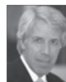
Alexander Niemetz Freier Publizist, Journalist Alexander Niemetz zählt zu den profiliertesten Journalisten und Beratern. Der gebürtige Schweizer ist TV-Coach zahlreicher Spitzenpolitiker und Top-Manager. Niemetz war fast zehn Jahre stellvertretender Leiter und Moderator des heute journals. Seit 2001 arbeitet er als freier Publizist, Journalist sowie als erfolgreicher Moderator und Medientoach.