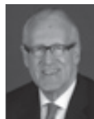
Horst Lenk Präsident Einzelhandelsverband Baden-Württemberg