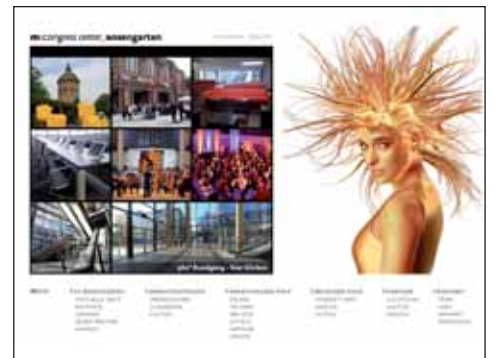
Gewinner des letzten Jahres www.rosengarten-mannheim.de .