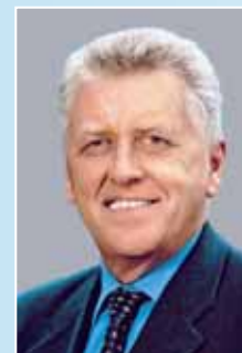
Wirtschaftsminister Ernst Pfister MdL

Baden-Württembergs Wirtschaftsminister, Ernst Pfister MdL wird persönlich den 1. Ulmer Handelsdialog eröffnen. Nutzen Sie die Chance, mit Top-Entscheidern aus Politik und Wirtschaft in persönlichen Kontakt zu treten und kommen Sie am 03.03.2009 zum 1. Ulmer Handelsdialog!